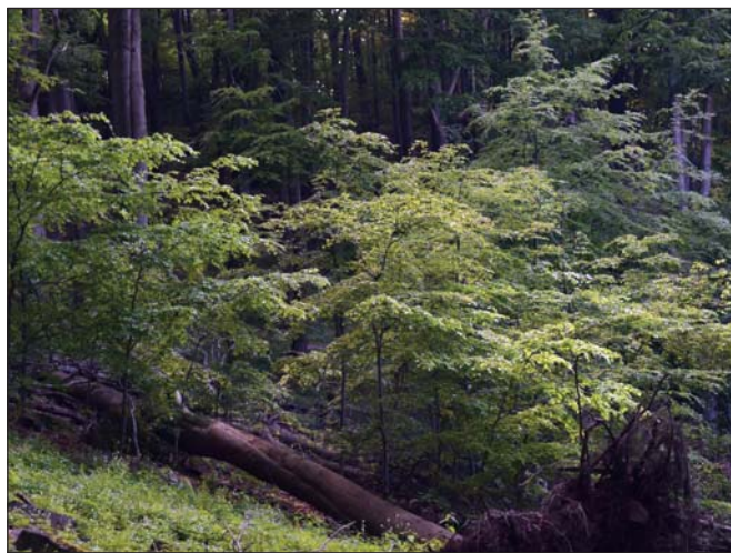
3. ábra. Természetes felújulás egy nagyobb lékben, Kékes Erdőrezervátum. Fotó: Horváth Ferenc, 2016