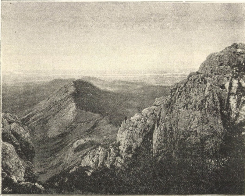
A Fehér-Szirt a Nagy-Szirtről tekintve.

Körtvélyesi pusztá felett emelkedő Czakóhegyet látjuk, míg északra a Dunát pillantjuk meg. Néma csend uralg e vadregényes tájon, melyen madáron kívül nem látni élő lényt.