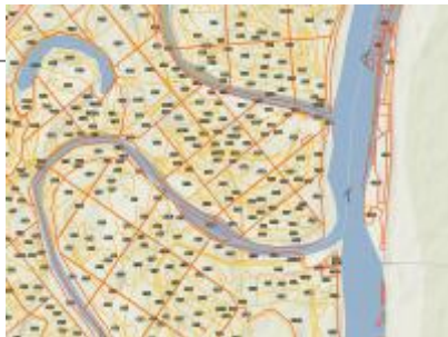
Buvat, Keszeges-tó ER és környéke, NÉBIH EI Erdőtérkép - Google TOPO Buvat, Keszeges-tó Erdőrezervátum NÉBIH EI - Google 2012 topo_29v.jpg