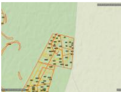
Farkas-sziget 1. ER és környéke, NÉBIH EI Erdőtérkép - Google TOPO