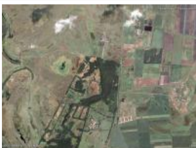
Farkas-sziget 1. ER és környéke, NÉBIH EI - Google úrfelvétel