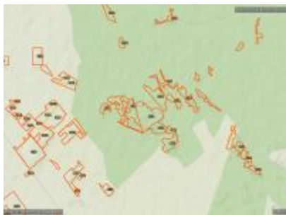
Közös-erdő ER és környéke, NÉBIH EI Erdőtérkép - Google TOPO