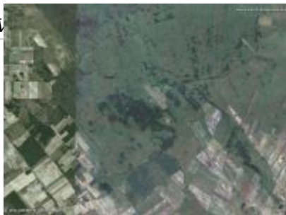
Közös-erdő ER és környéke, NÉBIH EI - Google úrfelvétel