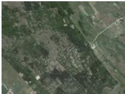
Nagybugaci ősborókás ER és környéke, NÉBIH EI - Google úrfelvétel Nagybugaci ősborókás Erdőrezervátum NÉBIH EI - Google 2012 orto_11v.jpg