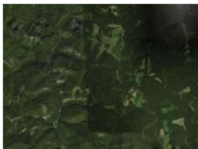
Pataj ER és környéke, NÉBIH EI - Google úrfelvétel Pataj Erdőrezervátum NÉBIH EI - Google 2012 orto_67v.jpg